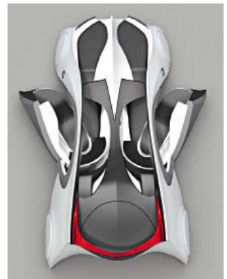
« Parmi les participants au concours Peugeot, GQ mise sur le projet Echo. Ci-dessus, la BMW ZX-6 d'étudiants de Turin.